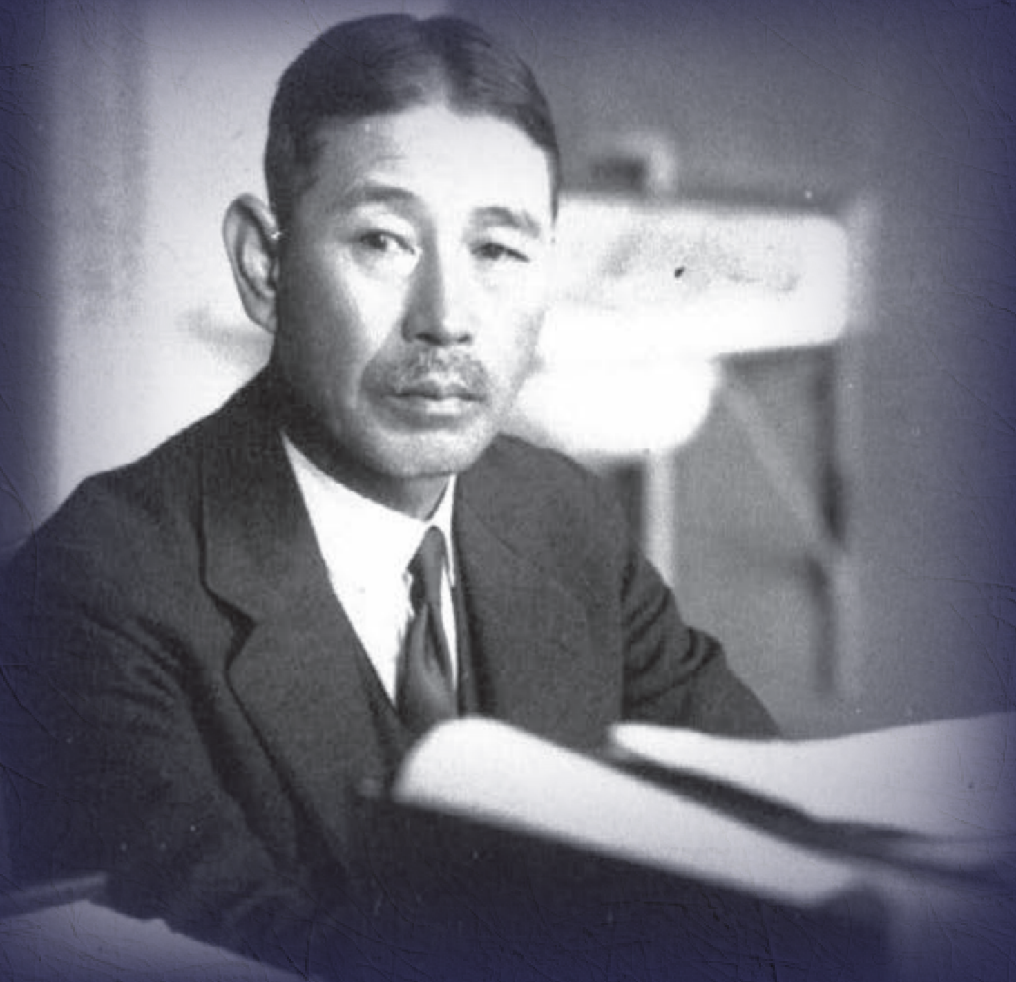
東北帝国大学 数学科初代教授 藤原松三郎